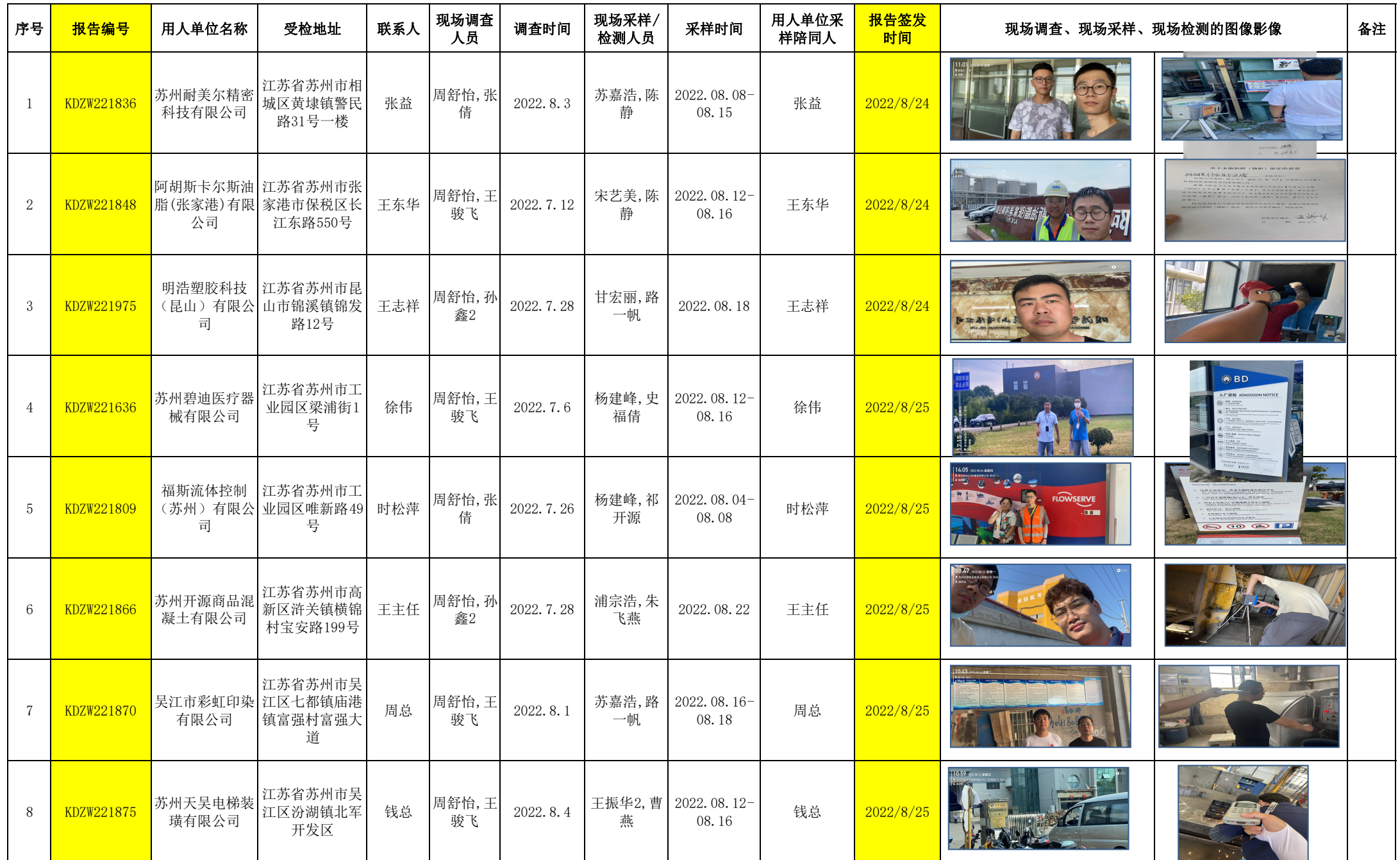
2022年8月24-25日职业卫生定期检测项目公示表