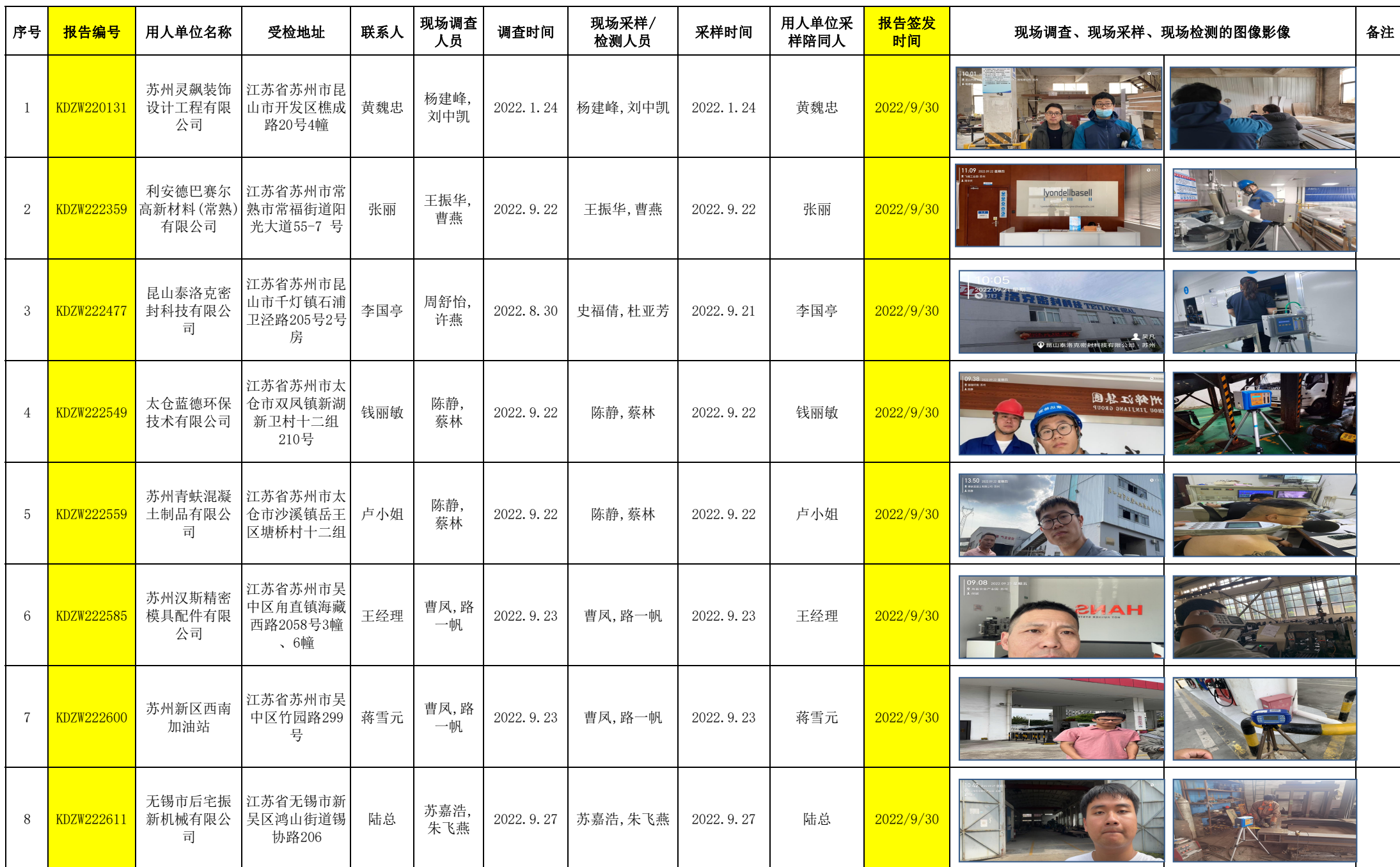
2022年9月30日职业卫生定期检测项目公示表