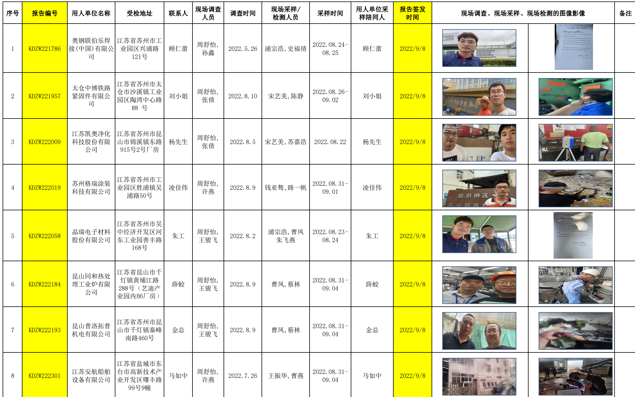
2022年9月8日职业卫生定期检测项目公示表