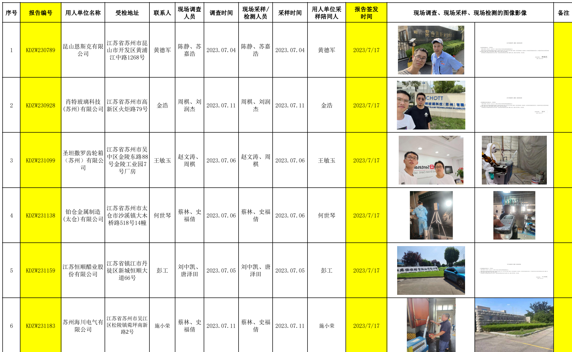
2023年7月17-21日职业卫生定期检测项目公示表