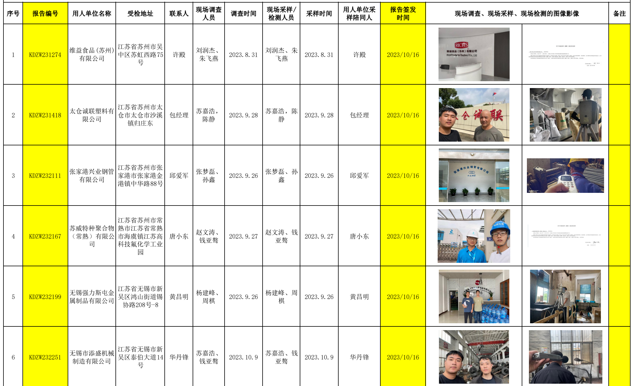
2023年10月16-20日职业卫生定期检测项目公示表